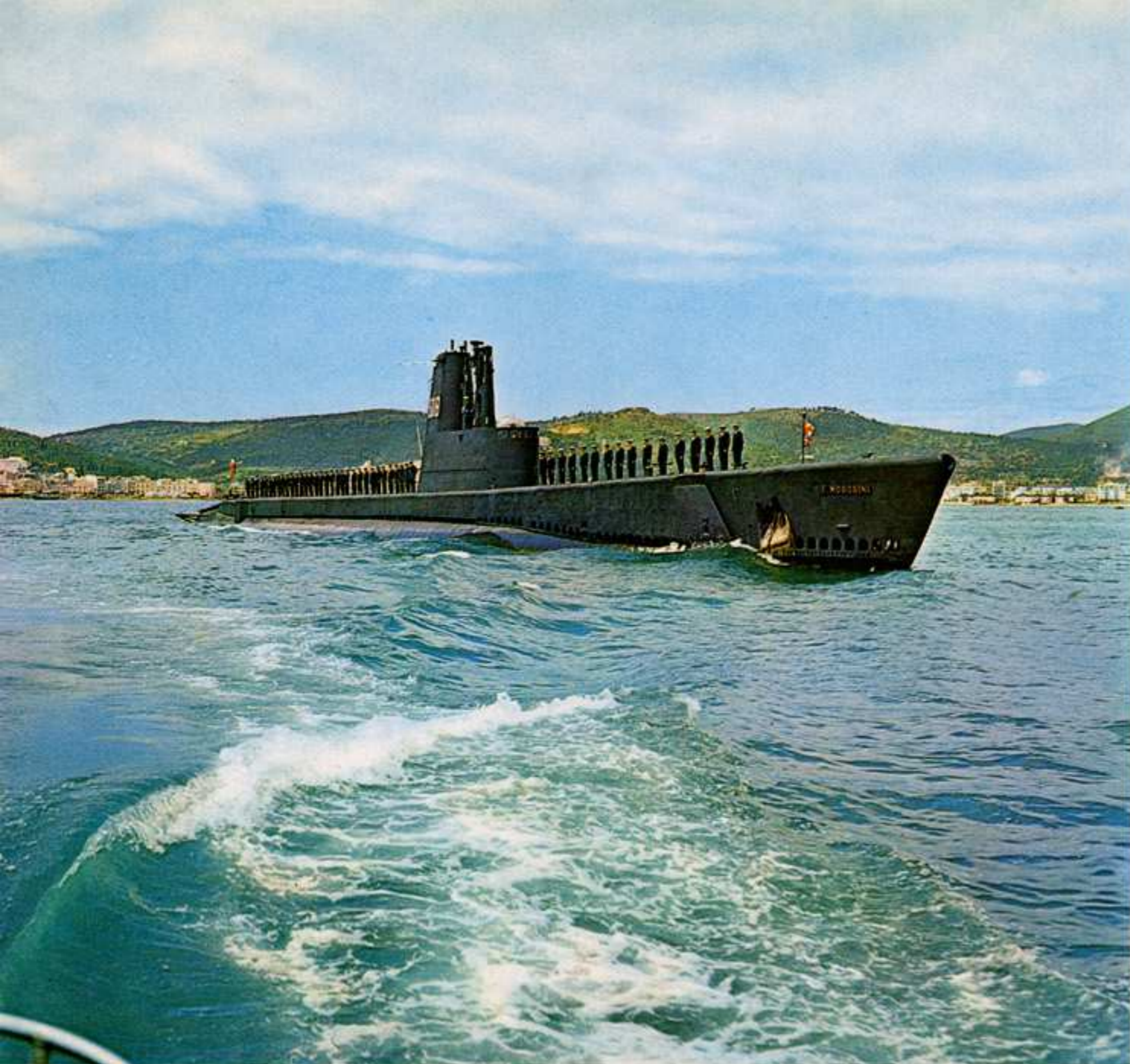
Sommergibili CAPPELLINI MOROSINI TORRICELLI